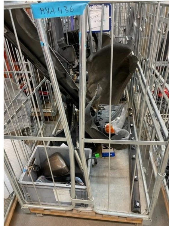
I vagn på avskild plats