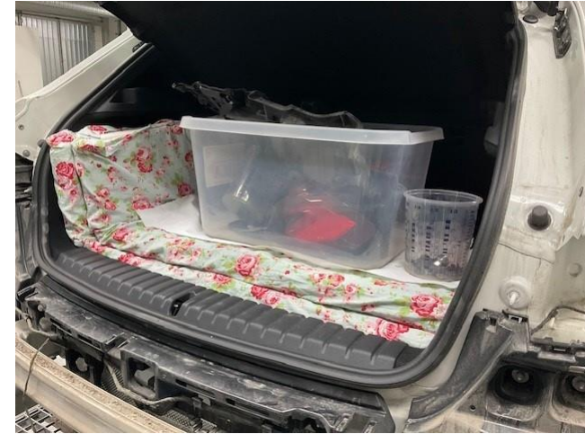
På skyddsplast i bagaget