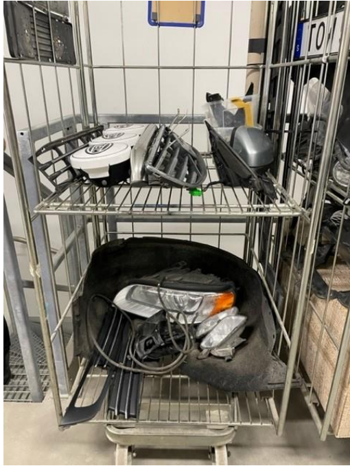
I vagn på avskild plats