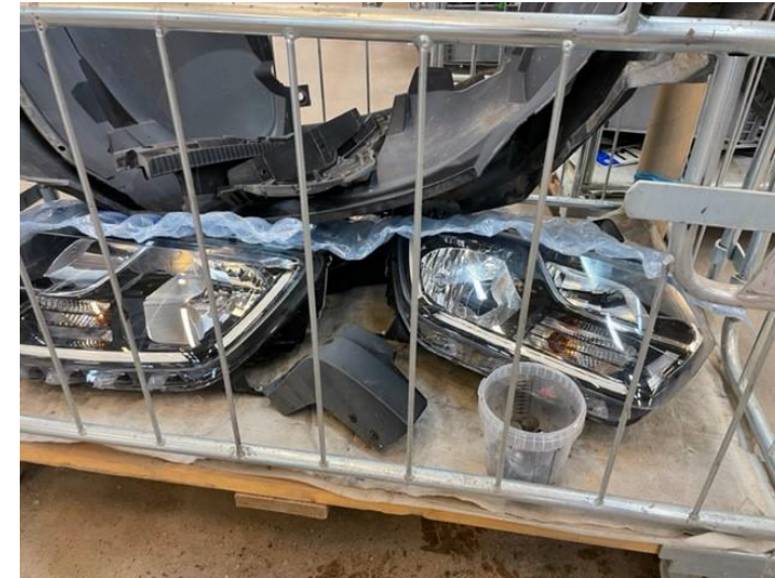
I vagn på avskild plats