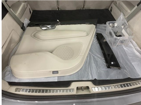
På skyddsplast i bagaget